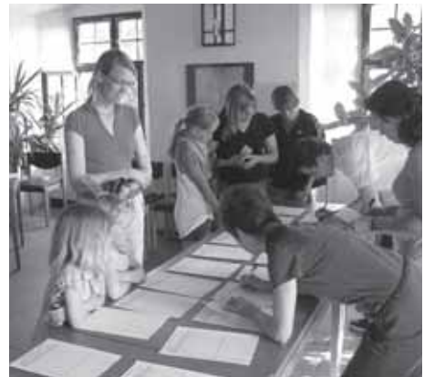
Anmeldung im Unterthingauer Schloss.