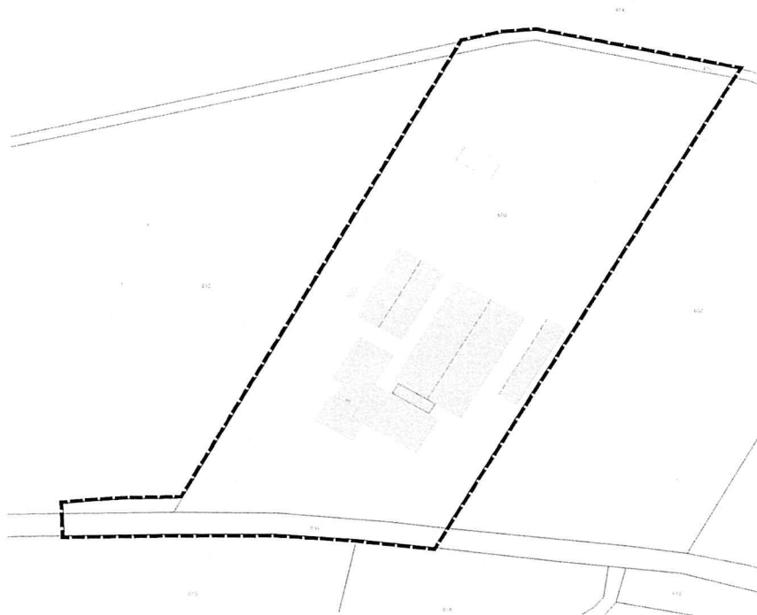
Abbildung 1: Lageplan des Geltungsbereiches des gegenständlichen Bebauungsplanes, unmaßstäblich

Im Einzelnen gilt der Lageplan vom 08.08.2022. Der Lageplan ist im folgenden Kartenausschnitt dargestellt: