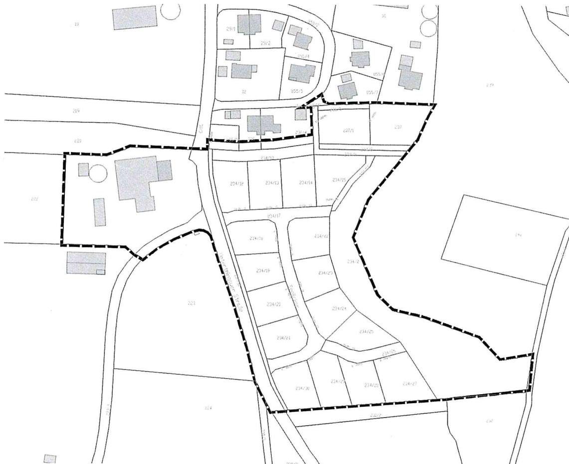
Abbildung 1: Lageplan des Geltungsbereiches des gegenständlichen Bebauungsplanes, unmaßstäblich

Im Einzelnen gilt der Lageplan vom 04.04.2022. Der Lageplan ist im folgenden Kartenausschnitt dargestellt: